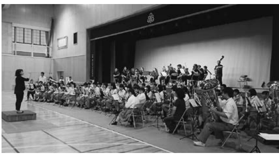
GIFA設立30周年記念事業 ドイツカーニジウス高校 オーケストラ部 郡上高校 訪問（令和元年十月）

コロナ禍、今こそ国際理解と協力が必要とされていると思います。今年は海外の大学生とオンラインによる活動