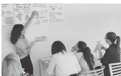
ドミニカ共和国にて

今回の会では、手に入りやすい一般的なバナナをplátano de verdeに混ぜて作りましたが、バナナ甘さとしっとり感がアクセントになって、日本風のyaroalになっ