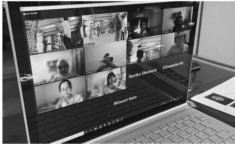
2001岐阜大学夏季短期留学生サマースクール オンライン交流の様子

令和三年度GIFAの活動はコロナ禍でもできる事をやってみようとスタートしました。中心的な継続事業である岐阜大学サマースクールと岐阜県世界青年友の会(GWY)香港の大学生の受入事業は、オンライン開催をお誘い戴き積極的に取り組みました。どのように交流できるのかと不安もありましたが、岐阜大学、GWY、相生小学校、地元の皆様のご協力のおかげで有意義な交流事業を開催する事ができました。同時に日本語や日本文化に興味を持ち理解しようとしている若者がこんなにも世界中にいてくれるのだと思うと、国際理解、文化交流の大切さを再確認しました。