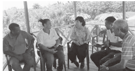
ドミニカ共和国にて

意外な人気だったmondongo。日本では料理にモツを使うことが少ないですが、ドミニカではいろいろな部位が売られていて、香草と一緒に煮込む料理は定番です。番組収録時にGIFAの関係者の方たちと試食したのですが、ダントツで人気でした。現地では「Maggi」のブイヨンがどの家庭にもあるくらいポピュラー。ドミニカ料理の再現性をぐっと高めてくれる調味料です。